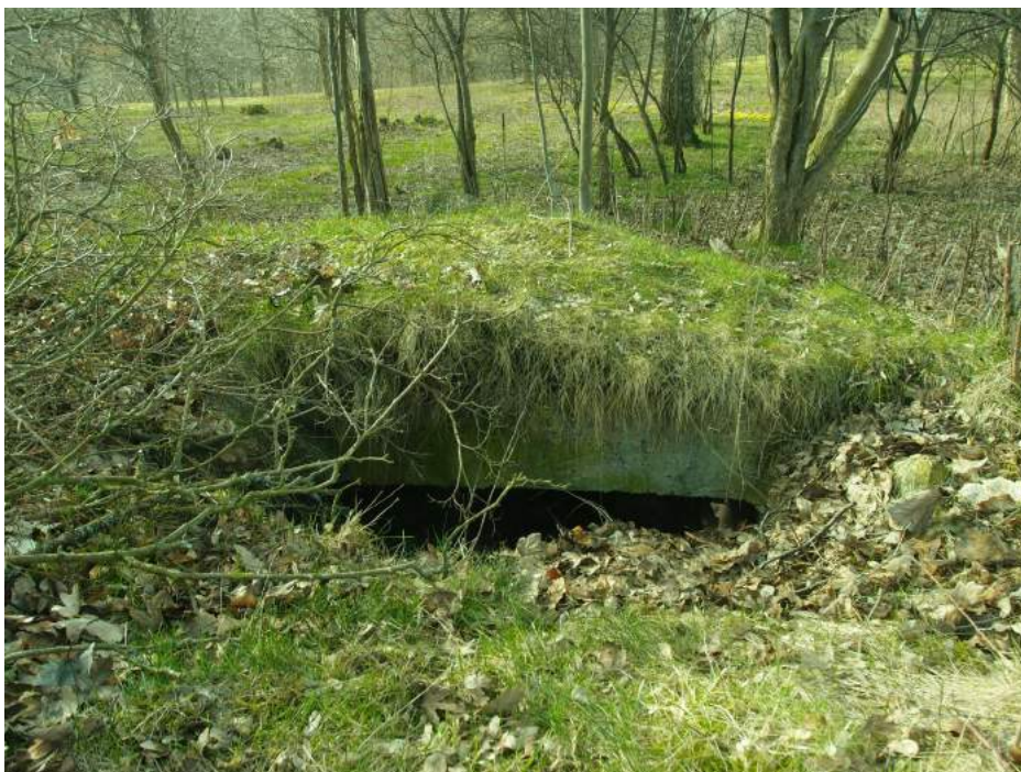
Spør af kælderåbning i Kovangsgårdens ruin 2014.