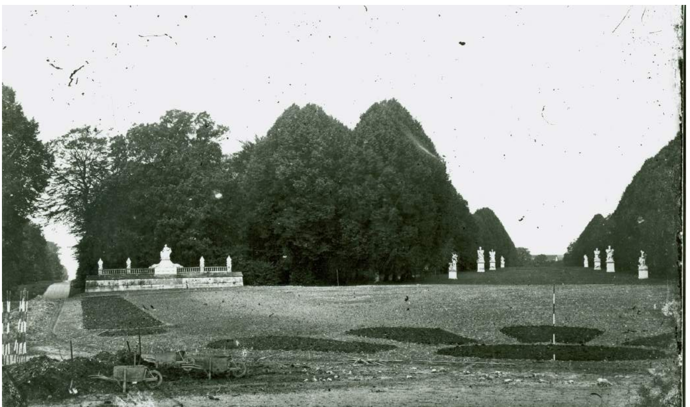
Udsigt fra slottet med Kovangsgården i horisonten mod nord ca. 1892.